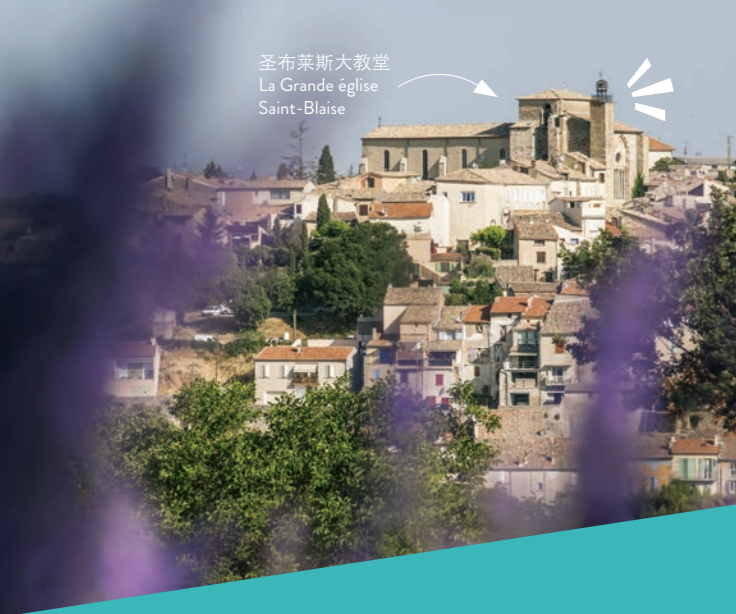
圣布莱斯大教堂 La Grande église Saint-Blaise