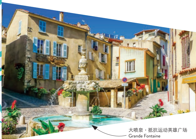
大喷泉，抵抗运动英雄广场 Grande Fontaine Place des héros de la résistance

取道镇上小路，您可以欣赏附近古色古香的店面，享受复古风格的雅致。离开大喷泉，沿右侧走上大喷泉街Rue de la Grande Fontaine，在肉店Boucherie处向左转。