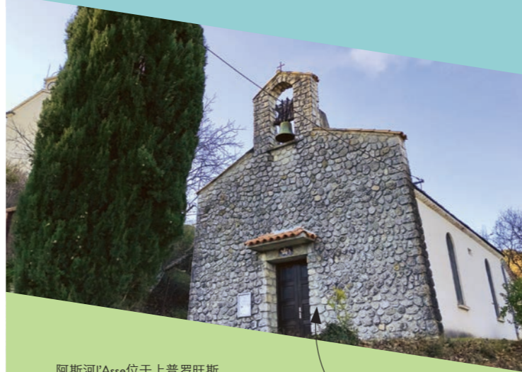
阿斯河l'Asse位于上普罗旺斯阿尔卑斯境内瓦伦索勒高原边界，是迪朗斯河的支流。

本地区最杰出的历史人物当属圣马约尔Saint-Mayeul(公元910-994)，勃艮第克吕尼修道院的第四任院长。他出身于Fouque家族，于934年将他家族的宅邸和圣马克西姆教堂赠与教会。这些捐赠成为了克吕尼教的物质和精神的象征，一直保存到法国大革命时期(1791)。